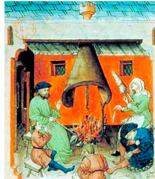
Una família medieval gaudint de la calor de la cuina. La dona porta l'inevitable fus per aprofitar el temps d'oci. [ Fig. 100 ]

Un celler era una estança usual als habitatges de Binissalem, però no tan sols s'usava per guardar-hi vi. Allà s'hi podia guardar la palla, altres productes del camp, eines, i fins i tot, animals. Si la casa típica era petita i hi manava la dona, al celler s'hi podien reunir els homes per beure, tractar assumptes o jugar a cartes. El "seller" de Can Garriga fou tan conegut i freqüentat durant molts anys del segle XIV que es dubta si era d'un particular o es tractava d'un negoci. Els Garriga