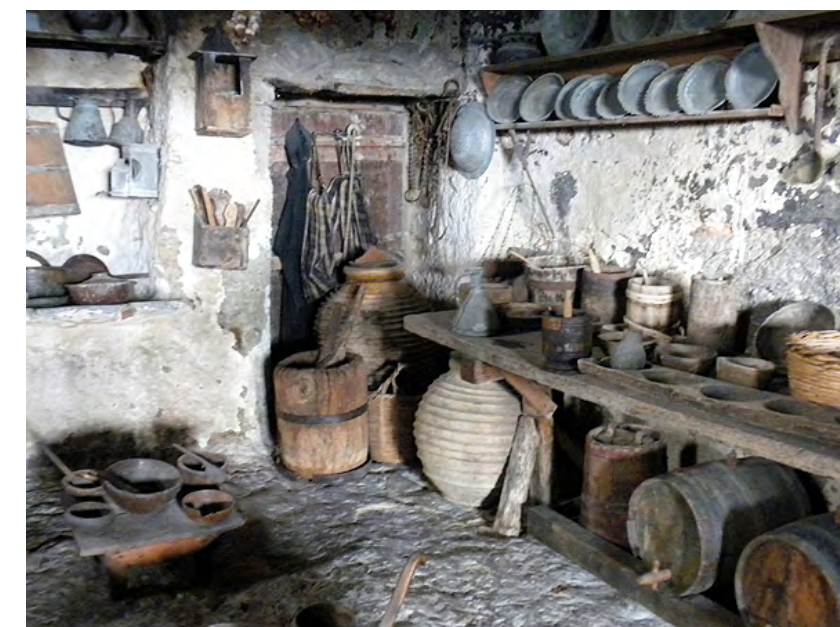
Aquesta cuina es troba a un monestir grec. Encara que és una foto d'ara, segur que poc ha canviat des de la seva fundació al segle XIV; l'època moderna no ha arribat aquí. [ Fig. 98 ]

No es troben als inventaris moltes vaixelles de test, ja que solien ser de fusta. Les poques ceràmiques que hi havia s'havien dut de la península. Encara no es coneixien les forquetes, però hi havia diferents tipus de ganivets. Per menjar s'empraven sobretot culleres de fusta. Una portadora de gerres era important per guardar l'aigua potable.