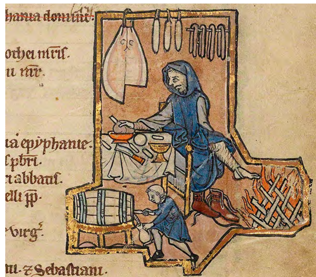
Un viatger menja a una taverna del camí mentre escalfa els peus al foc. La seva vestidura suggereix que fa molt fred fora. Encalentic-se els peus així és comú en imatges medievals, evidentment les sabates donaven poca protecció del fred i humitat, i no tots tenien sabates. [ Fig. 104 ]

Els que anaren a Costitx, però, ho feien cavalcant, en part per la urgència de l'empresa. El mateix Andreu Borràs, tornat ja de Tofla i Aiamans, no es mostrava animós