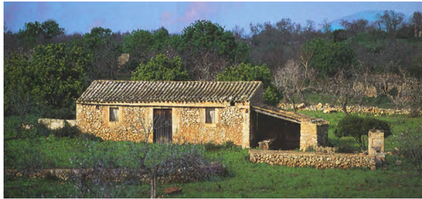
Una casa rural de l'estil designat 'andalusí' per l'arquitecte Carlos García-Delgado Segués, que és l'estil tradicional popular de Mallorca. Encara és un habitatge molt senzill. [ Fig. 99 ]

Robert Fossier destaca una possibilitat sorprenent, donat que les construccions de pedra són molt perdurables. (Hem de recordar que els edificis de l'època que tractam no estaven fets de blocs de pedra, sinó de tàpia o de mamposteria pobra) "Resulta bastante curioso que estas moradas no parecen inertes, construidas para durar a lo largo [...] al contrario, se trasladaban, no demasiado lejos, en cada restauración o reconstrucción, pero la arqueología puede mostrar que con frecuencia se modificaban sus cimientos ¿Debido a la ligereza de sus materiales, si llegaba el caso? ¿O a la evolución demográfica, incluso económica?" (2008, pp. 119-20).