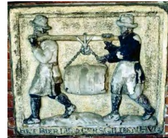
Una manera de transportar líquids, en aquest cas la cervesa, a Mallorca era el vi. [ Fig. 101 ]

Tal circumstància havia de dificultar enormement el moviment de mercaderies i afectava el preu de tot article transportat. En un article publicat a La España Medieval , l'historiador Pau Cateura comparava els costos de diferents mitjans de transport al segle XIII i calculava que, tot i els perills i pèrdues, el cost del transport marítim, fins i tot entre pobles costaners, quedava "reducida a la proporción de tramos de diez kilómetros recorridos, [...] queda por debajo del promedio del transporte por tierra" (1997, p.119-21, pdf: p. 63-65). A Binissalem, però, no hi havia aquesta opció.