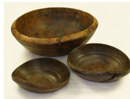
Escudelles de fusta. Aquestes han estat recuperades d'una barca enfonsada. [ Fig. 97 ]

Altres mobles gairebé universals foren les caixes i les posts o els pedrissos que servien de prestatge. A les cases més acomodades tan sols es multiplicava el nombre d'aquests mateixos elements. Sembla inevitable que