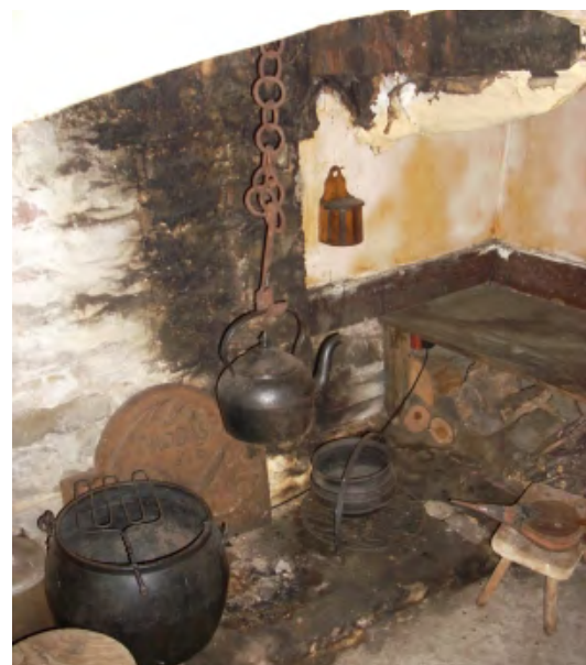
Una xemeneia típicament medieval, noti's la brama per reanimar el foc i la petita caixa de sal penjada a la paret [ Fig. 103 ]

Per a una persona en forma, una caminada de 10 o 12 quilòmetres era normal per resoldre afers, però no per motius d'oci. Quan els prohoms cercaven una manera d'evitar que s'esdevingués la batalla de Binissalem, circulaven en grups de dos o tres per tota la comarca cercant les dues bandositats. Andreu Borràs “i lo dit Antoni Steve partiren de la dita vila a peu i feren la via de Toffla i passaren per assò den Vilalonga”** . L'hora en què començaren a xerrar de la possibilitat de fer la recerca, era “envers posta del sol” i la meitat de la caminada era amb pendent amunt (Gabriel Llompart, 1988, p. 36 i 37).