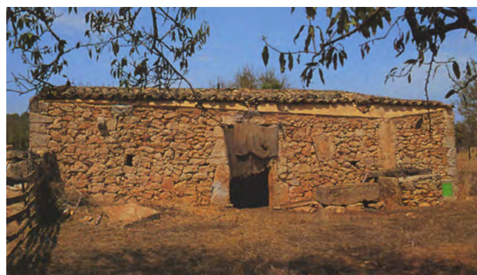
Una casa rural mallorquina de l'estil més senzill i sense finestres, tan sols petites obertures quadrades per evacuar el fum del foc. (Clar que tenia porta). Encara així era més sòlida que els habitatges bàsics d'altres parts d'Europa: estructures prismàtiques construïdes de bastons coberts amb palla. [ Fig. 96 ]

Sabem que els colonitzadors, a més d'edificar, empraren com a habitatges alberchs sarraïns i mesquites que havien trobat en arribar a Mallorca. Molts dels primers obrers de la construcció foren esclaus àrabs que treballaven amb les tècniques tradicionals.